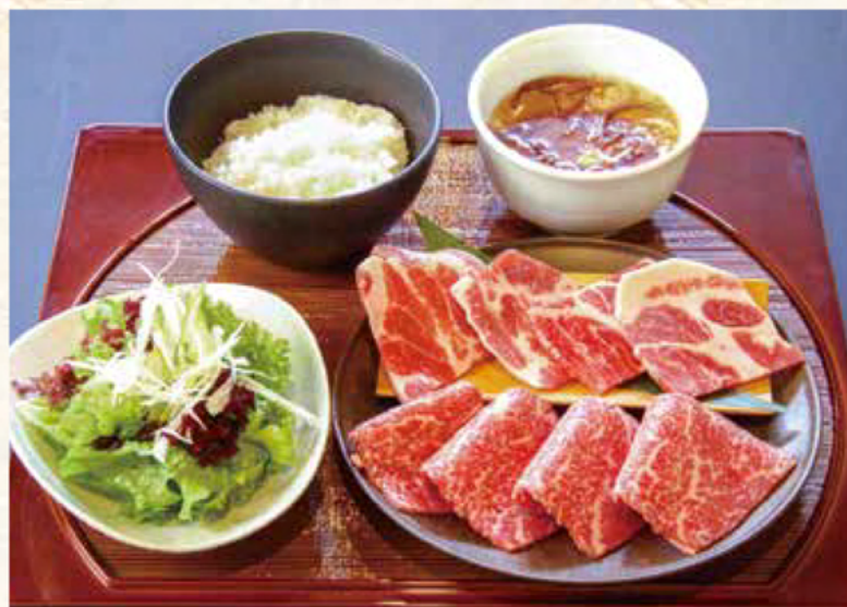
焼肉ランチセット 羽後本荘ランチ