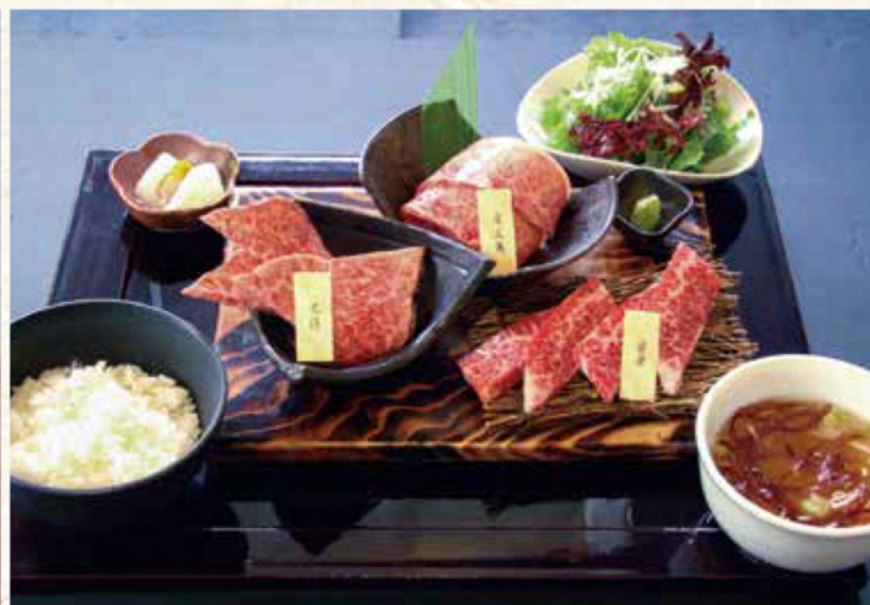
焼肉御膳 鳥海山御膳