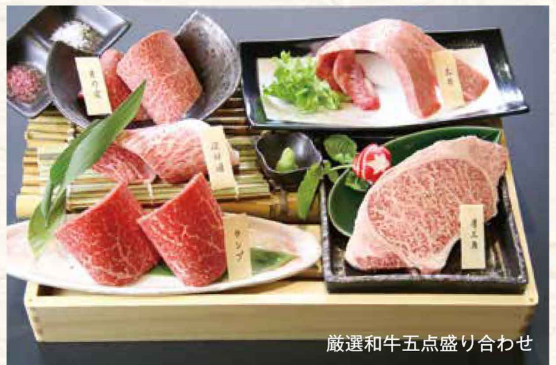
厳選和牛五点盛り合わせ