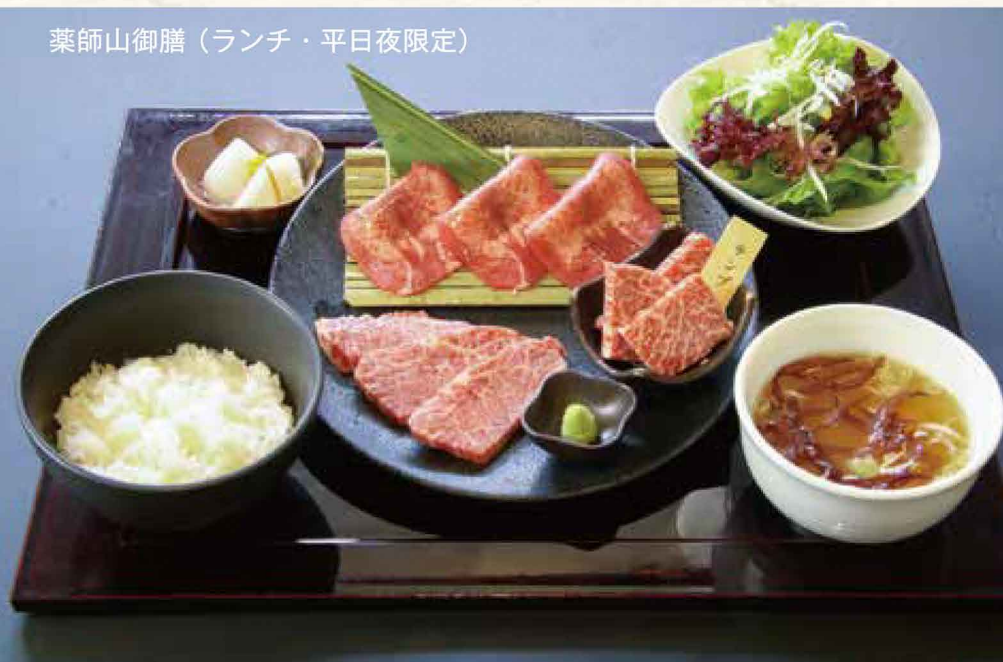
薬師山御膳 (ランチ・平日夜限定)