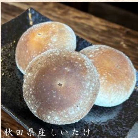
秋田県産しいたけ