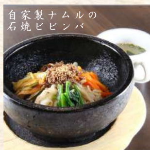
自家製ナムルの 石焼ビビンバ