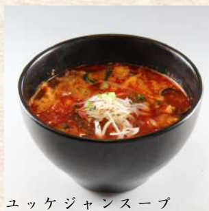
ユッケジャンスープ