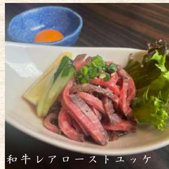
和牛レアローストユッケ