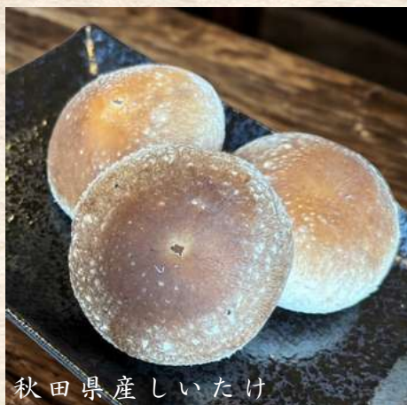
秋田県産しいたけ